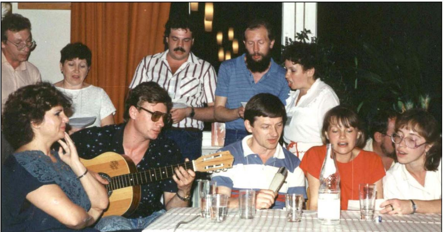
Erste Bürgerreise aus Kursk: Der „Club Globus“ besucht im August 1989 den Wittener Freundeskreis und die Stadt Witten