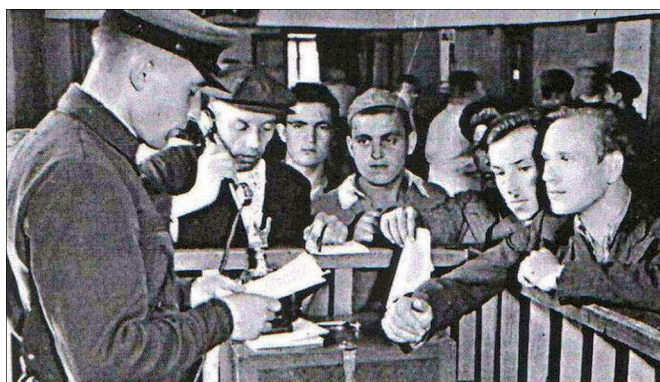
Запись добровольцев в военкомате

Seit Beginn der Kriegserklärung versammelten sich jeden Tag Menschen in der Nähe der Straßenradios und warteten auf Nachrichten. Erst am Montagmorgen, 23. Juni, wurde im Radio die erste Zusammenfassung aus dem Stab des