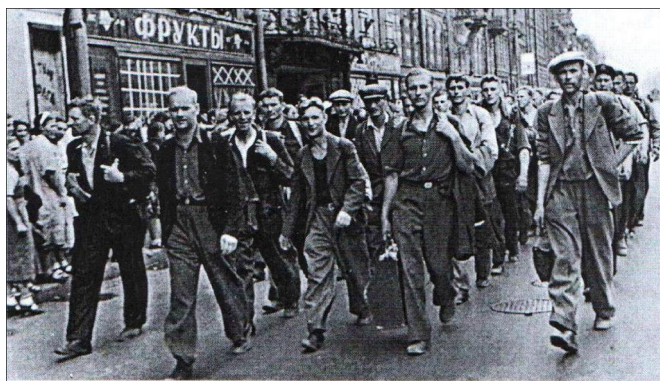
Вставай, страна огромная... Курск, улица Ленина, добровольцы следуют к сборному пункту

In den ersten drei Monaten des Krieges wurden mehr als 207 Tausend Menschen aus der Region Kursk mobilisiert, auf dem Territorium des Gebiets wurden Divisionen gebildet, die an den schweren Kämpfen an der West-und Brjansk-Front teilnahmen.