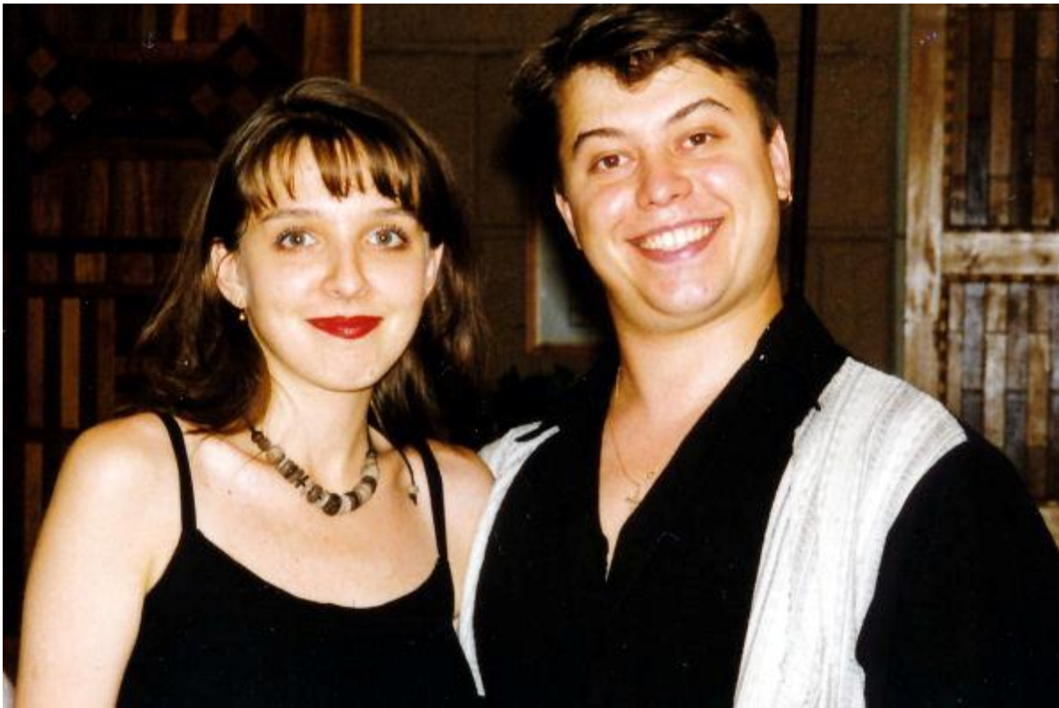
Zwei junge Nachwuchs-Schauspieler im Puschkin-Theater