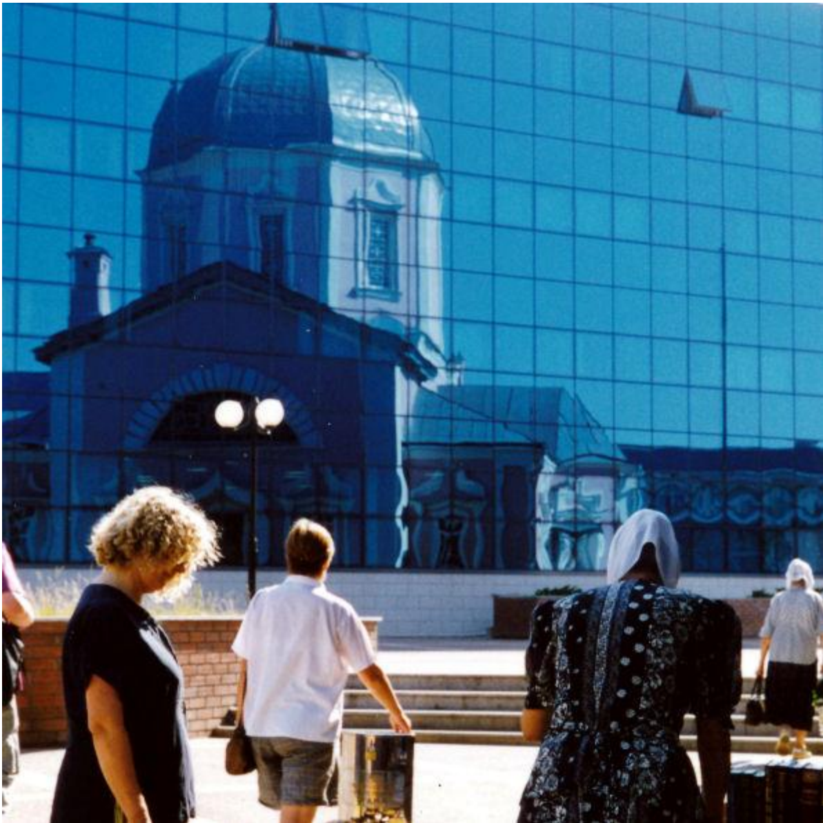
Das alte und das neue Kursk Die historische Kirchenfassade spiegelt in der neuen Glasfassade einer Bank