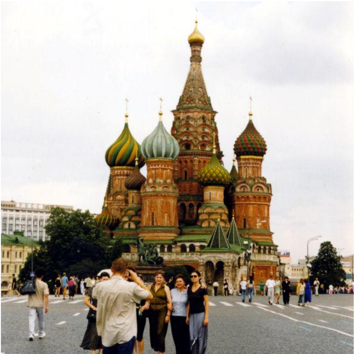
Kurzbesuch in Moskau auf der Rückreise