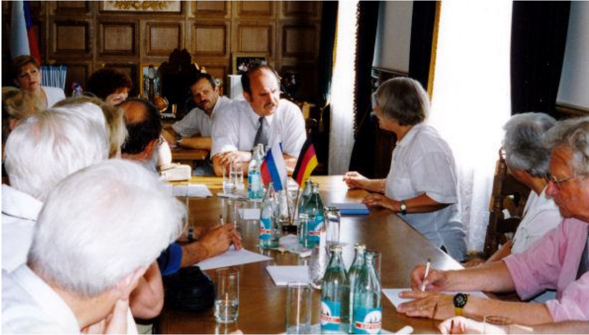
Besuch beim Kursker Bürgermeister