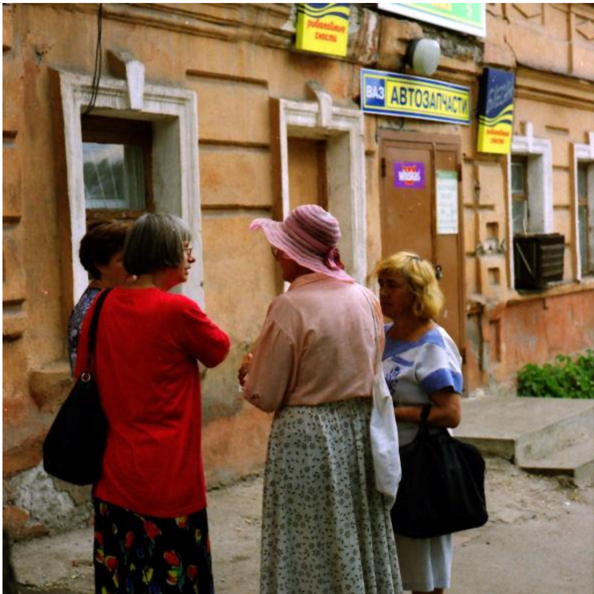
Rundgang in der Kursker Altstadt