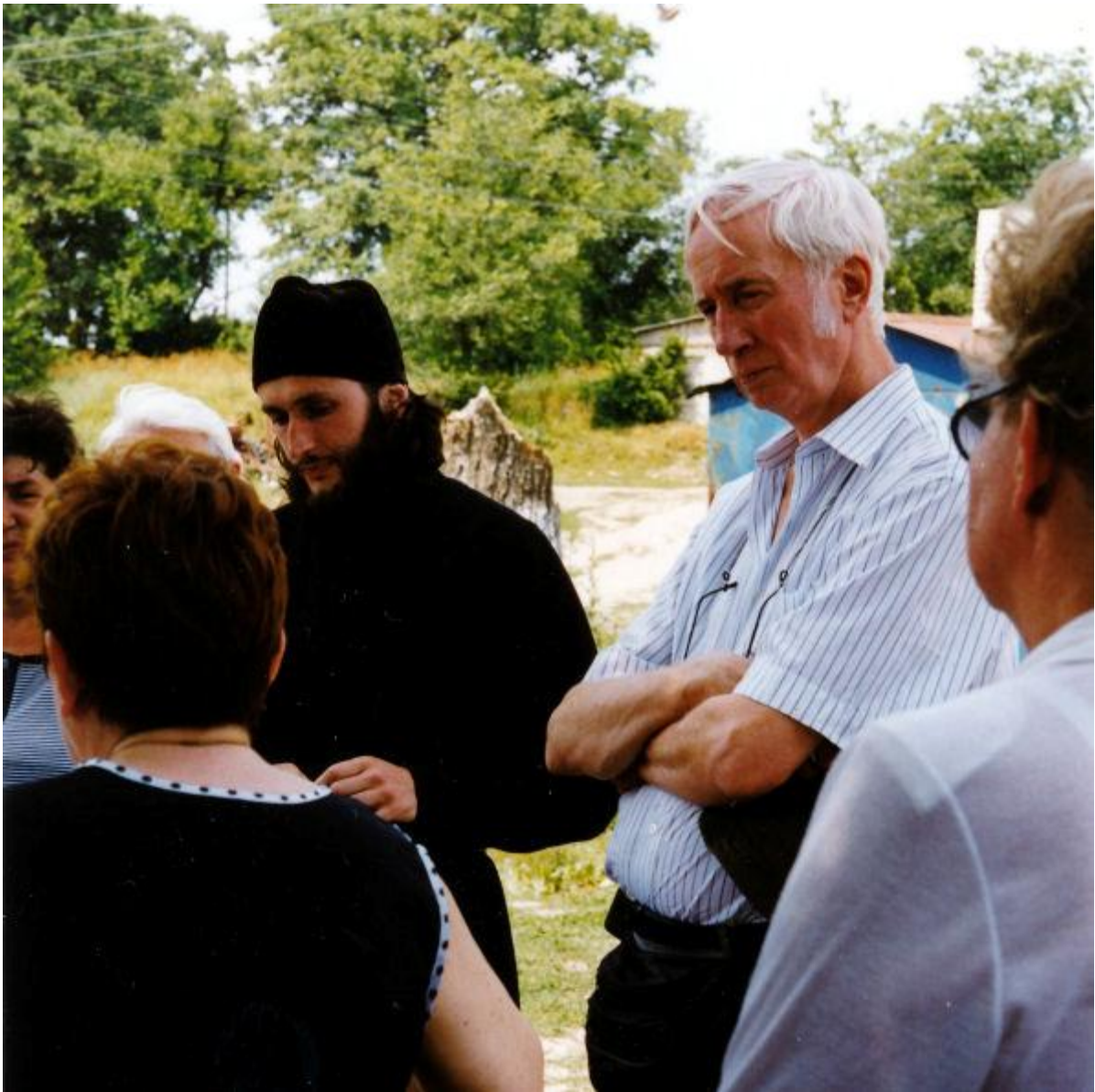
Besuch im Kloster Rilsk im Kursker Gebiet