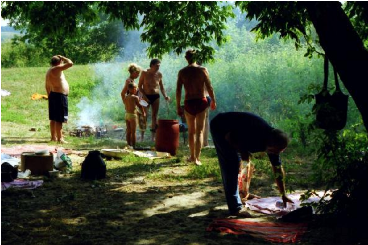
Einladung zum Picknik am Fluss